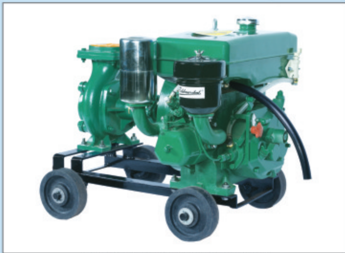
HORIZONTAL WATER COOLED PUMP SET

Direct Water Connection For Constant Cooling